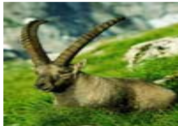
野 生 山 羊

区别特点：在夏天，岩羚羊有一件金宗色的大衣它被叫做黑鳗。背下是条纹。在冬天，这件大衣变的很明显。它又长又黑，角笔直，间端弯曲着。