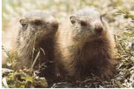
土 拨 鼠

土拨鼠是生活在阿尔卑斯山草地和牧场地树线以下的。在 Jenner , Wasseralm 和 Funtensee 地区你很容易看见它们。冬天他们在地洞里冬眠。